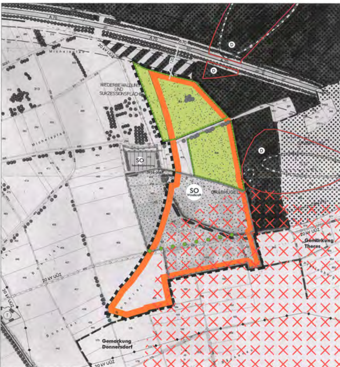
7. Änderung des Flächennutzungsplans