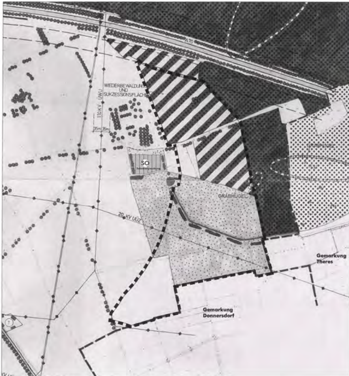
Rechtskräftiger Flächennutzungsplan in der Fassung der 6. Änderung